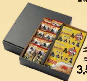
ギフトセット 鳥めしの素2箱・鳥スープ10個 3,500 円(税込3,780円)