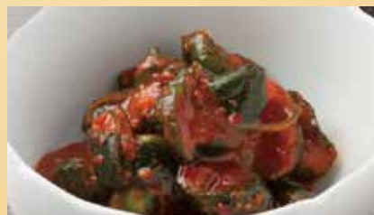
きゅうりキムチ 450円