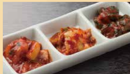
キムチ三種盛り 550円