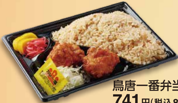
鳥唐一番弁当 741円(税込800円)