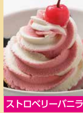
ストロベリーバニラ