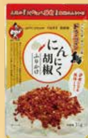
にんにく胡椒 ふりかけ 単品 500 円(税込 540円)