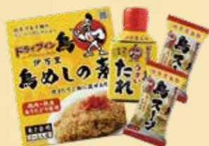
ドラ鳥一番セット 鳥めしの素 1箱・うまいたれ 1個・鳥スープ 2個 1,600 円(税込 1,728円)