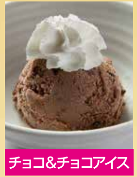
チョコ&チョコアイス