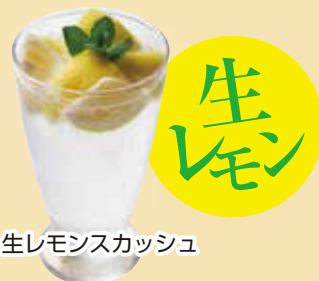
生レモンスカッシュ