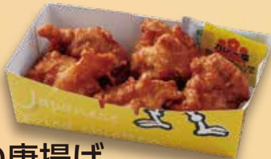
若どりの唐揚げ 750円(税込810円)