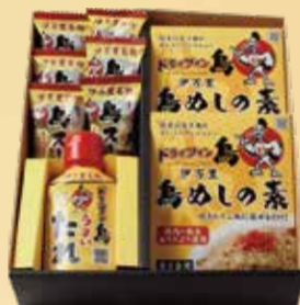
たれ入り ギフトセット 鳥めしの素 2箱・鳥スープ6個・たれ 1個 3,150 円(税込 3,402円)