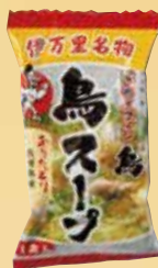
鳥スープ 単品 195 円(税込 210円)