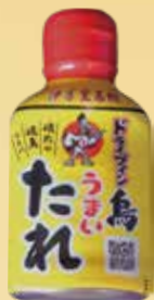
ドライブイン鳥の うまいたれ 単品 630 円(税込 680円)