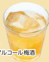
ノンアルコール梅酒