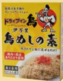
鳥めしの素 (米2合用) 単品 630 円(税込 680円)

ドライブイン鳥の人気メニューを全国の皆様にお届けしたく、試行錯誤を重ね、数年の歳月を経ていよいよ完成いたしました！鳥の旨味がしっかり出ていて、店の味に近いものになっています。店舗で販売する他、楽天でも公式オンラインショップがオープンしています。お土産に、ギフトに、何より自分用に。ドラ鳥の旨さを是非ご自宅でも。