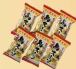
鳥スープ 6個 詰合せ 1,100 円(税込 1,188円)