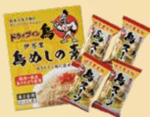
おみやげセット 鳥めしの素 1箱・鳥スープ 4個 1,400 円(税込 1,512円)