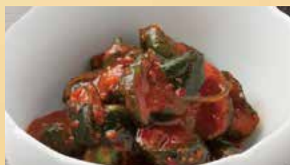
きゅうりキムチ 450円