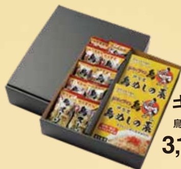
ギフトセット 鳥めしの素 2箱・鳥スープ10個 3,150 円(税込 3,402円)