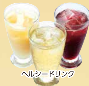
ヘルシードリンク